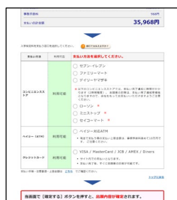
②支払い方法を選択する