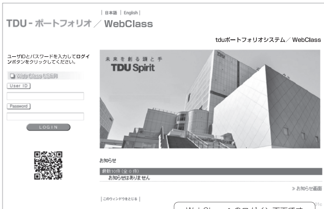
WebClass へのログイン画面です

※本文中に記載の画面デザインやメニュー（機能）構成等は、今後変更になる場合があります。