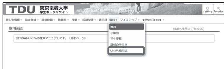
図 2 UNIPA 使用法

詳しい操作方は、UNIPA 内の「資料」タブにある「UNIPA 使用法」より確認してください。(図 2)