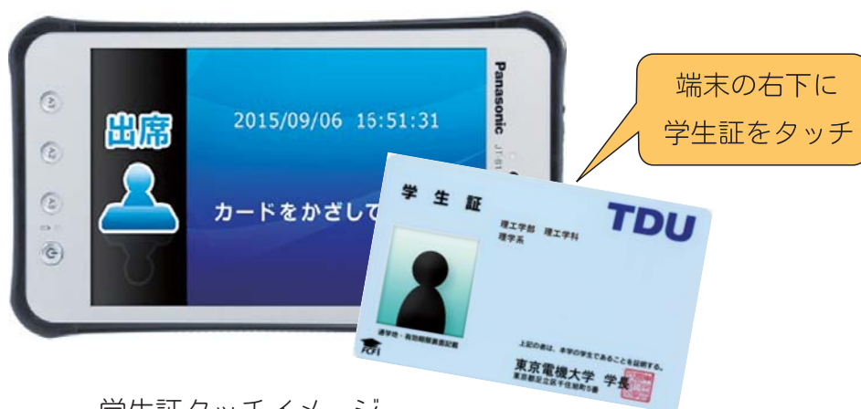
学生証タッチイメージ

授業の出席確認は、授業教室においてタブレット端末に、学生証をタッチして行います。担当教員の出席確認の指示に従って行ってください。授業によっては、遅刻・早退等の確認をするため、複数回の出席を取る場合もあります。タブレット端末にて出席確認を行った場合は、DENDAI – UNIPA で確認することができます。また、出席確認の方法は、授業によってはタブレット端末によらない場合もありますので、教員の指示に従ってください。学生証を忘れた場合は、授業時に担当教員に申し出てください。