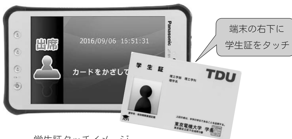
学生証タッチイメージ

授業の出席確認は、授業教室においてタブレット端末に、学生証をタッチして行います。担当教員の出席確認の指示に従って行ってください。授業によっては、遅刻・早退等の確認をするため、複数回の出席を取る場合もあります。タブレット端末にて出席確認を行った場合は、DENDAI－UNIPAで確認することができます。また、出席確認の方法は、授業によってはタブレット端末によらない場合もありますので、教員の指示に従ってください。学生証を忘れた場合は、授業時に担当教員に申し出てください。