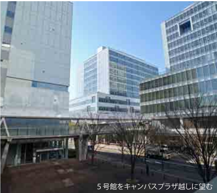
5号館をキャンパスプラザ越しに望む