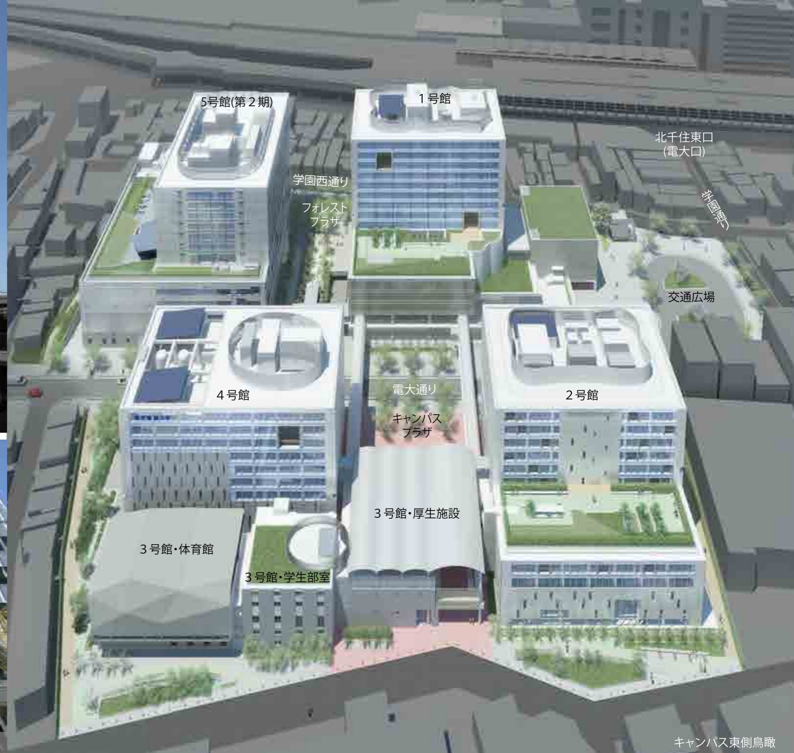
キャンパス東側鳥瞰