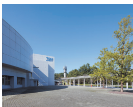
〔埼玉鳩山キャンパス〕