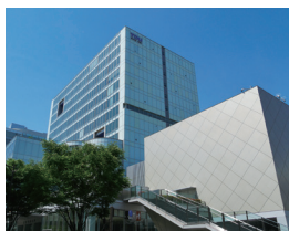
〔東京千住キャンパス〕