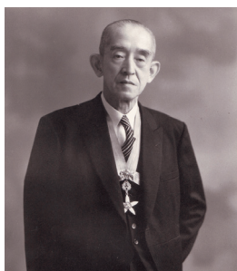
〔初代学長 丹羽保次郎博士〕